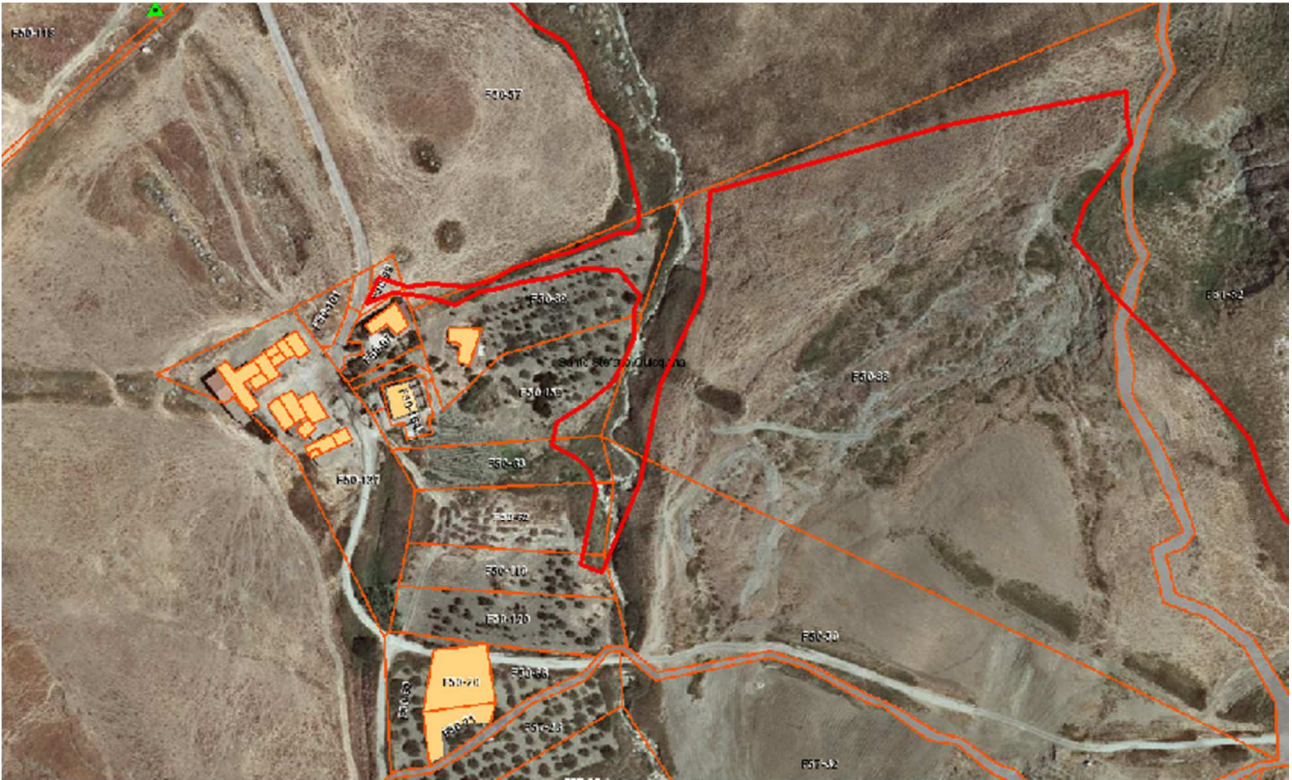
Porzione Area 1 – Foglio 50